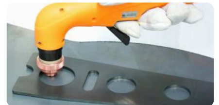
Schablonenschnitte | Template cuts