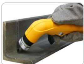
Lange Verschleißteile Long consumables