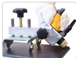
Fasenschneideinrichtung Bevel cutting device