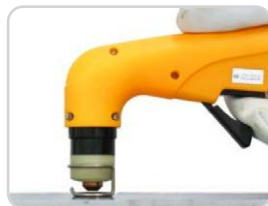
Distanzfeder | Spacer spring