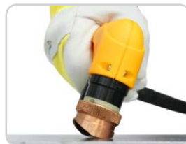
Fasenkronen | Beveling cap