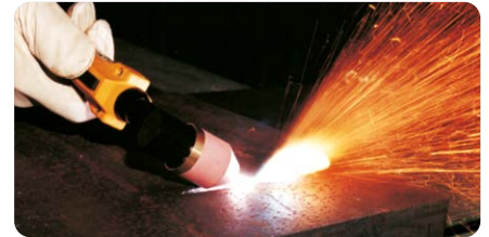
Plasmafugen zur Vorbereitung von Schweißnähten Plasma gouging for weld preparation purposes

A large variety of accessories is available for the flexible use of the CUTi units.