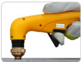
Aufsetzkappe | Contact cap