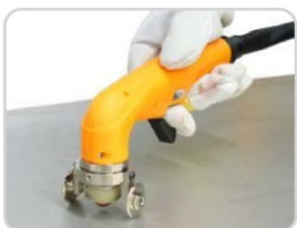
Räderwagen | Wheel guide