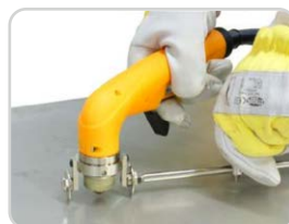
Kreisschneideinrichtung Circle cutting device